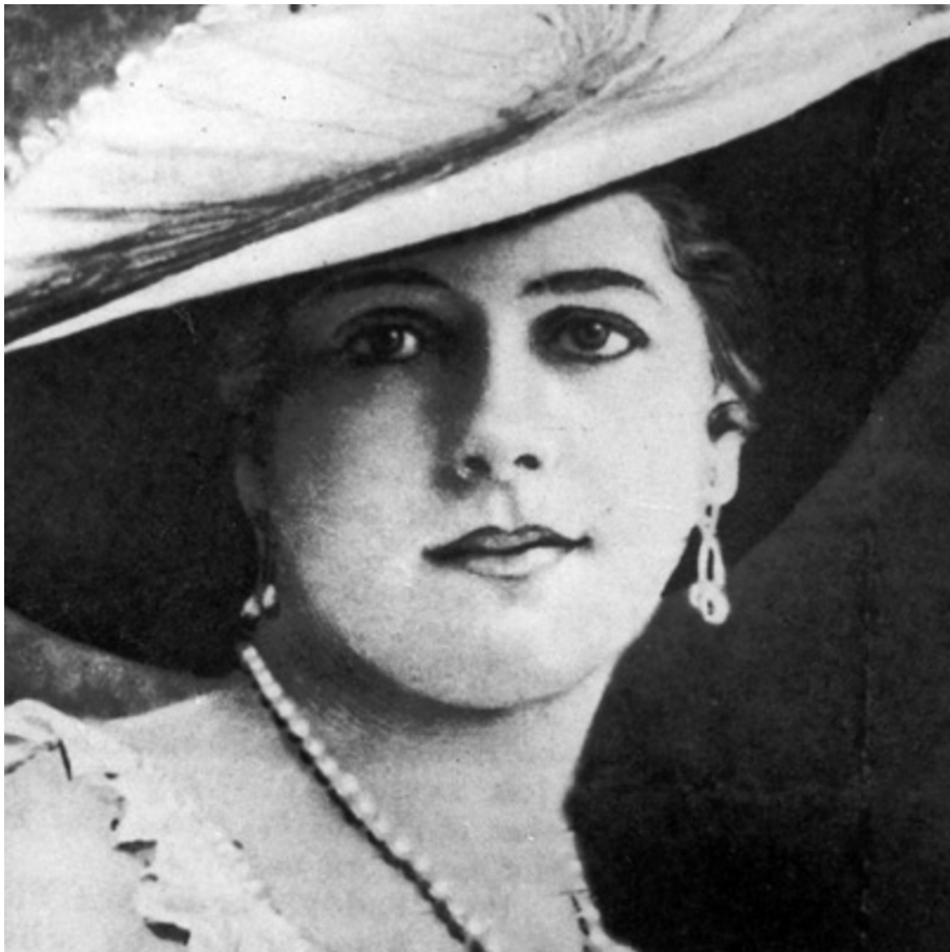
Margaretha Gueertruida Zelle "Mata Hari"

della Grande Guerra nei locali esclusivi di Parigi e di Berlino, di New York e di Milano (Giacomo Puccini era un suo grande ammiratore), che si mise nei guai da sola parlando troppo, e nei momenti sbagliati, ai suoi numerosi amanti francesi e tedeschi ancora una volta l'un contro l'altro armato. La giovane donna, nata in una cittadina olandese, si chiamava Margaretha Gueertruida Zelle ma tutti la conoscono col suo esotico nome d'arte, Mata Hari.