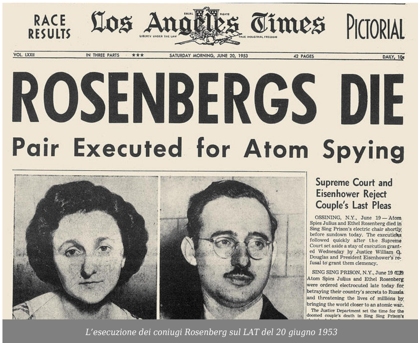
L'esecuzione dei coniugi Rosenberg sul LAT del 20 giugno 1953

Il sospetto assunse però un carattere strutturale non solo nelle dittature (sovietica, nazista o fascista) ma anche in alcune grandi democrazie come gli Stati Uniti d'America. Basti ricordare il clima di delazioni e di sospetti ai tempi del maccartismo contro intellettuali, attori di Hollywood e scrittori, o le condanne alla sedia elettrica dei coniugi Rosenberg, spie "ebree e comuniste", spinti a passare segreti ai sovietici dal loro idealismo e dalla convinzione, comune soprattutto a molti fisici nucleari come Fuchs e Pontecorvo, che la pace potesse essere preservata solo in regime di "duopolio atomico" Usa-Urss.