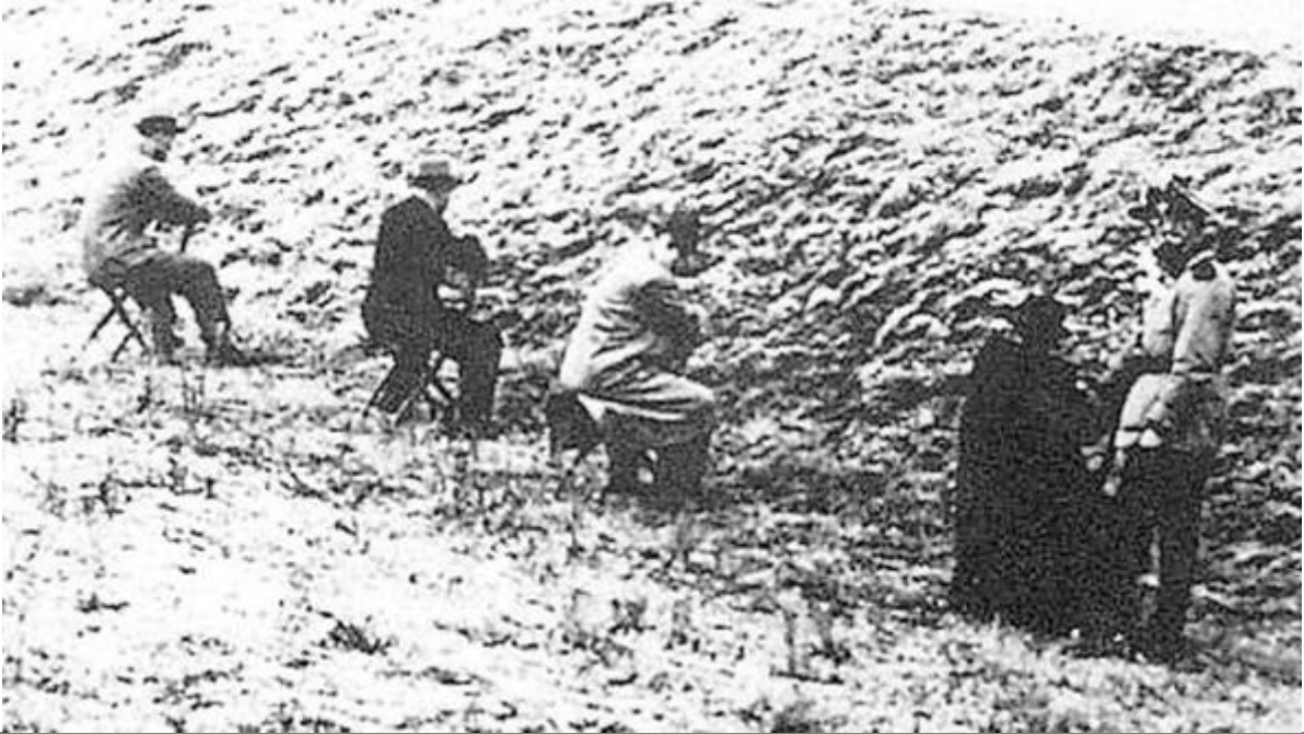
Galeazzo Ciano si gira con gesto di sfida al plotone di esecuzione un attimo prima del fuoco

suoi interessantissimi Diari, firmò l'ordine del giorno ma anche la sua condanna a morte che sarebbe sopraggiunta a Verona sei mesi dopo.