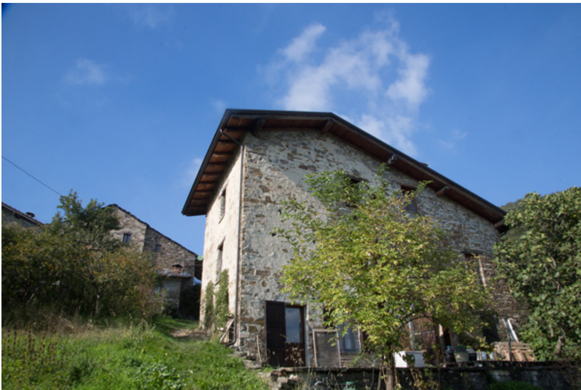
Case del borgo di Mogliazze

Stiamo vivendo tanti di quegli stravolgimenti! Sono arrivati quei pidocchi dall'estremo Oriente, la Varroa, che hanno messo le api in condizione di pericolo. Ha fatto la sua comparsa la zanzara tigre che sta scalzando la vecchia zanzara autoctona. I cambiamenti sono tanti, e nessuno sa come si andrà a finire e che cosa comporteranno. In più questi accadimenti anomali, le bombe d'acqua potenti e impensabili che cadono in poche ore. E trombe d'aria con venti di duecento chilometri all'ora che si sviluppano anche a fine ottobre. Qui le trombe d'aria si sono sempre sviluppate al massimo nei mesi di luglio e agosto. Poi ci sono certi cosiddetti esperti che dicono che tutto ciò è sempre successo. Fatto sta che tutto quanto sta avvenendo è qualcosa di fortemente anomalo. Non so spiegarmi altrimenti delle trombe d'aria alla fine di ottobre nel bellunese, a un passo dalle Alpi. Mi sembra un fatto decisamente strano. Con l'abbattimento di una marea di pini e abeti, che certamente sono facili da sradicare perché non hanno un apparato radicale molto forte.